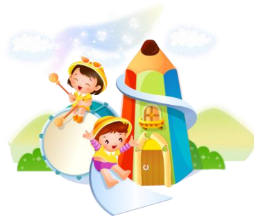
Дитячий Світ Замкової Гори