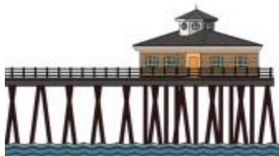
Безпечна човнова станція Житомира