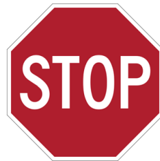
Життя дорожче за гроші!